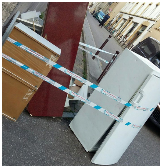
Effet de la coercition VS tonnages collectés

Partenariat avec Police Municipale pour recours à la vidéo surveillance sur les points noirs à partir de main courante (180 caméras actuellement > 1000 prévues en fin de mandat)