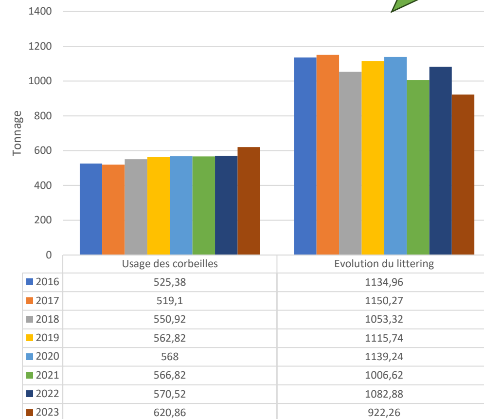
Evolution des tonnages collectés