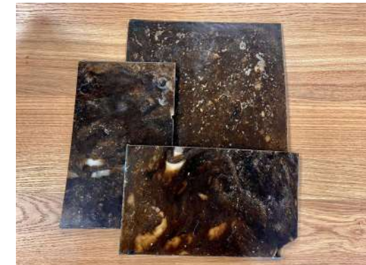
Plaque de sensibilisation obtenue après séparation et tri, broyage et dépollution et thermo-compression