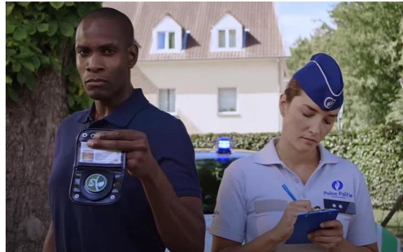
Intensification des contrôles en matière d'abandon de déchets