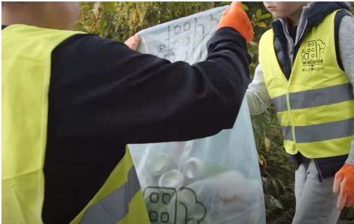
Organisation de ramassage dans l'espace public