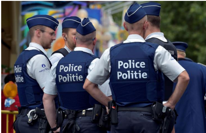
Policiers locaux (71 zones de police)