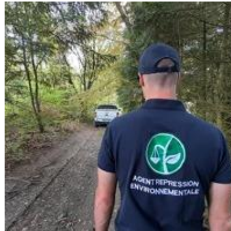
Agents constatateurs locaux (262 communes)