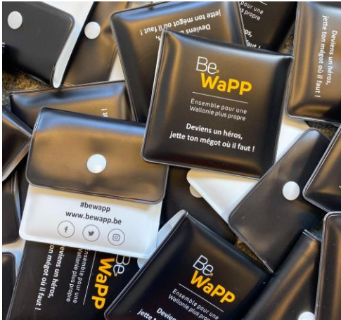
Cendriers de poche