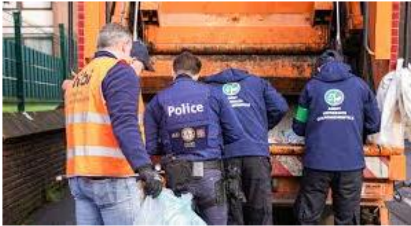
Patrouille conjointe police et agents constatateurs