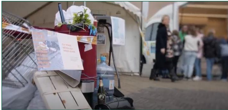
Sensibilisation des citoyens

Le Marathon de la Propreté est une opération d'une semaine, composée de 3 types d'action, proposée aux acteurs de la répression environnementale.