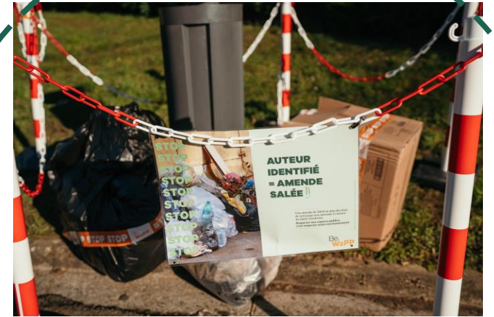
Utilisation du kit rubalise