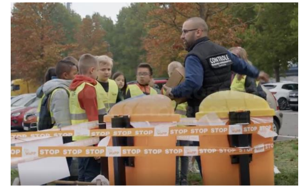
Éducation des plus jeunes