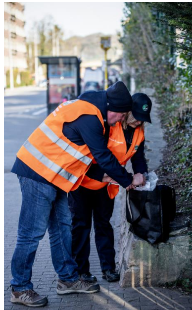
Fouille systématique des dépôts clandestins