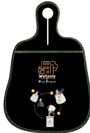
Poubelles de voiture