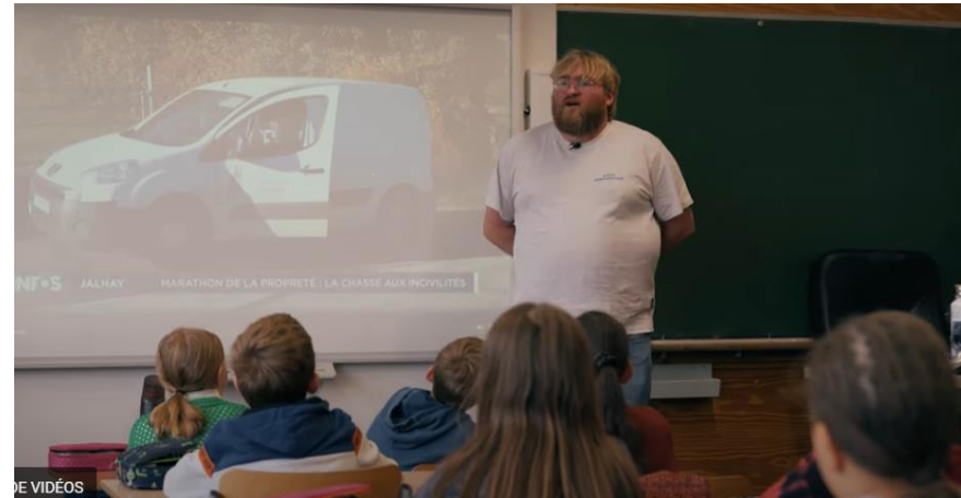
Sensibilisation à l'abandon des déchets dans la nature