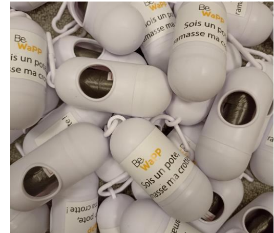
Distributeurs de sacs canins