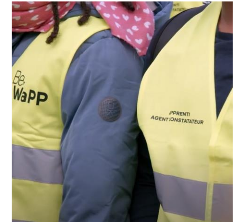
Jeux de rôle « Apprenti agent constatateur »