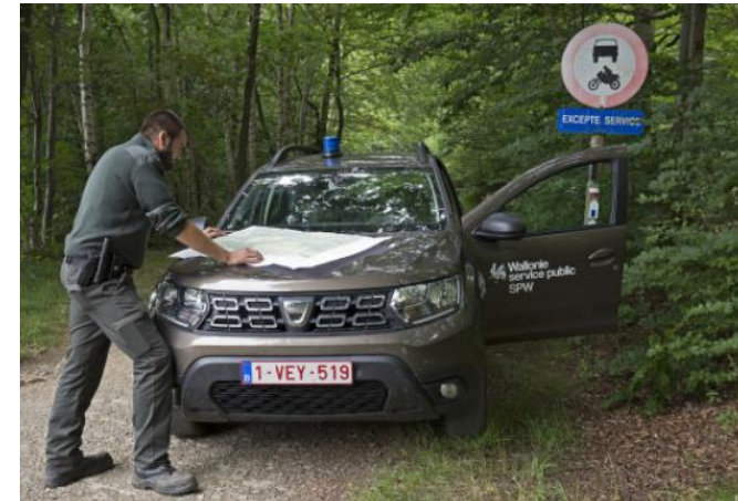
Agents constatateurs régionaux (1 région)